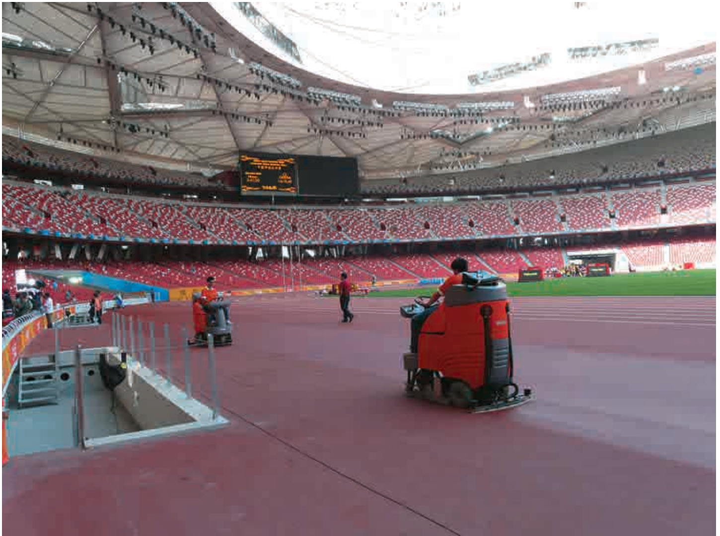
Hakomatic B 750 R im Einsatz auf der Tartanbahn des National Stadium. Das NST, aufgrund seiner besonderen Architektur auch liebevoll "Birds Nest" genannt, verfügt über eine Fläche von 25.800 qm und bietet Sitzplätze für 91.000 Zuschauer. Es ist während der 16 olympischen Tage der Austragungsort der Fußball- und Leichtathletikwettkämpfe und bot auch die beeindruckende Kulisse für die Eröffnungszeremonie am 8. August.

A ls am 8. August 2008 die 29. Olympischen Spiele in Peking im National Stadium (NST) offiziell eröffnet wurden, hatten einige ganz spezielle Athleten "Made in Germany" ihre Teilnahmeberechtigung bereits eindrucksvoll unter Beweis gestellt.